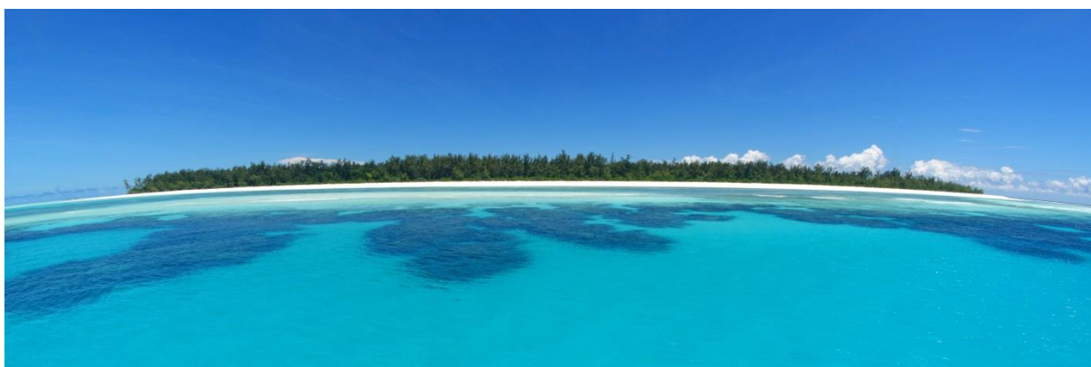
Île de Grande Glorieuse

Mercredi 25 avril, le conseil de gestion du Parc naturel marin des Glorieuses s'est réuni en visio-conférence depuis Paris, Saint-Pierre et Itoni. La séance s'est tenue sous la présidence de M. Bernard Cressens suite à sa réélection lors du renouvellement du conseil de gestion du 20 février 2018 (cf. dossier de presse du 26/02/2018). Le conseil de gestion a approuvé le rapport d'activités 2017 et le programme d'actions 2018.