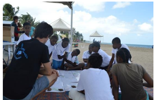
Jeu « Le voyage de la tortue » animé par Oulanga na nyamba

- apprendre à réutiliser de manière créative les déchets avec un atelier de découpe animé par Yes we can nette ,