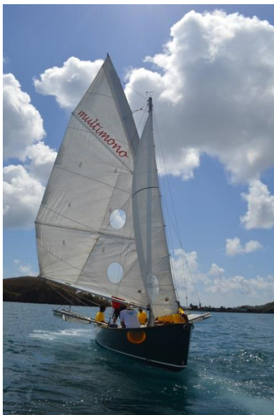
Le Multimono , petit voilier, pour faire découvrir cette navigation silencieuse, sans effets sur le milieu marin.

Lundi 20 août, le Parc naturel marin de Mayotte et ses partenaires ont réitéré l'opération Premières bulles au pays du corail sur la plage du Faré dans la commune de Dzaoudzi-Labattoir. Cent-vingt jeunes « petits-terriens » ont ainsi pu s'instruire et s'amuser le temps d'une journée au plus proche contact de la mer.