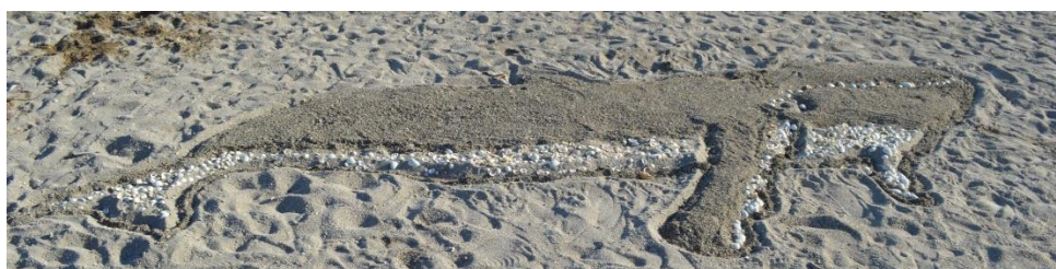
Baleine à bosse en land-art créée par l'équipe gagnante

Un concours de land-art a permis aux équipes ayant réalisé les plus belles créations de gagner des agendas scolaires.