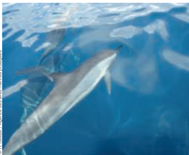
Dauphins vus d'avion, près de Mayotte.

« Cette méthode de comptage, par survol en zigzag à faible altitude, permet d'accéder à des zones où la mer est mouvoise, comme la côte « ou vent » des Antilles, et de couvrir de grandes distances. Elle fait donc exploser le nombre d'observations », commente le responsable scientifique de l'Agence. « Mais le bateau reste complémentaire, car il permet les études comportementales et le suivi individuel des animaux, en particulier grâce à la photo identification. En outre, l'utilisation de l'avion pose des questions environnementales. Le bilan carbone de la campagne est d'ailleurs en cours d'évaluation. »