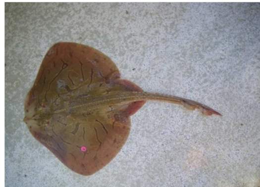
La raie brunette est facilement reconnaissable avec ses lignes noires sinueuses bordées de points blancs

Parmi ces cinq espèces, la raie brunette fait l'objet d'une interdiction de pêche depuis 2009 dans le cadre de la politique commune des pêches de l'Union Européenne.