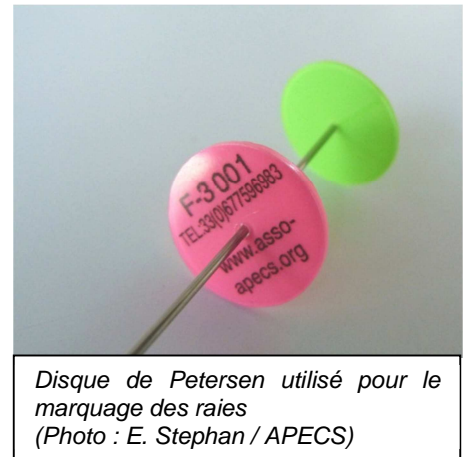
Disque de Petersen utilisé pour le marquage des raies

Des raies ont d'ores et déjà été marquées et relâchées et les marquages vont se poursuivre jusqu'au printemps 2014. A terme, 5000 raies devraient être marquées. Les marques externes utilisées, des disques de Petersen, sont de couleur rose et portent un numéro comportant la lettre F suivie de 4 chiffres. Les marques sont insérées au niveau d'une des nageoires pectorales.