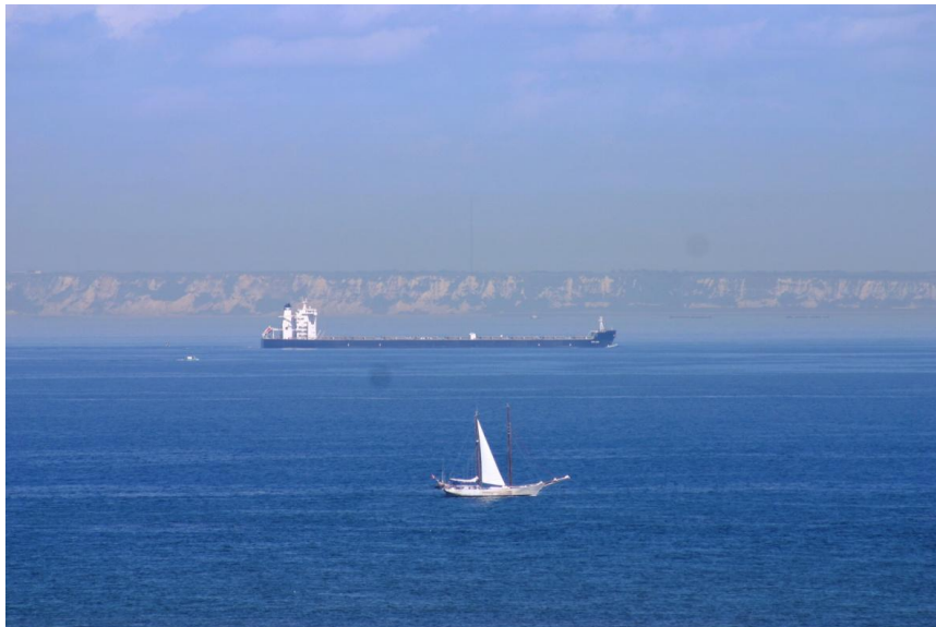
Ludivine Têtu / Agence des aires marines protégées